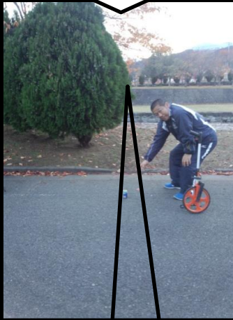
植木の切れ間 が目印