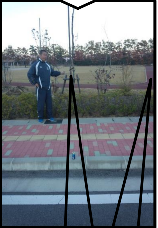
植木が目印 公園真ん中の 通路