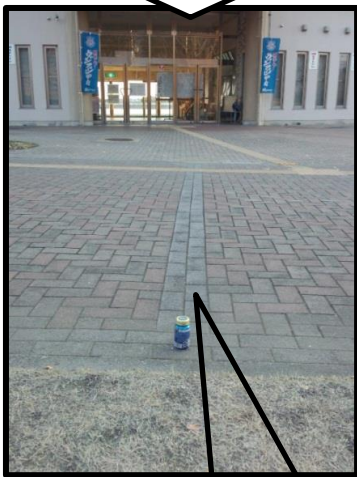
競技場正面玄関前 色の変った線