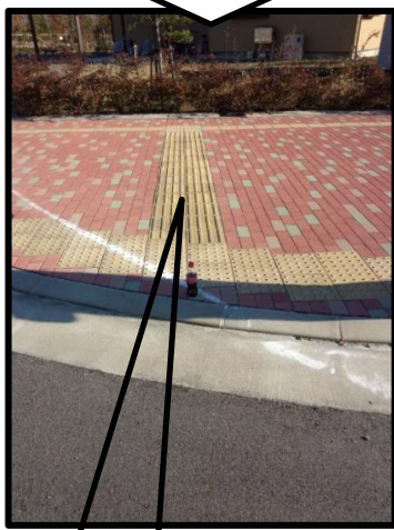
点字ブロック の延長線上