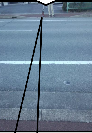
アパート入り口 の歩道が低い場所