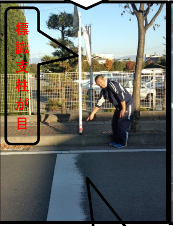
体育館に向かって 停止線右側